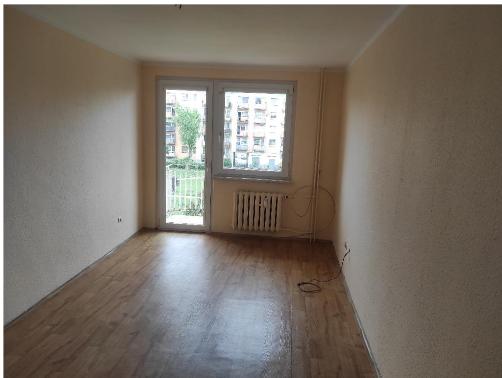
Zdj. 2 – widok na pokój