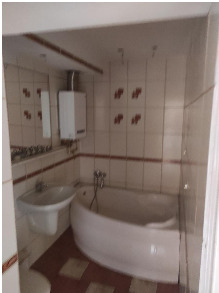
Zdj. 4 – widok na łazienkę