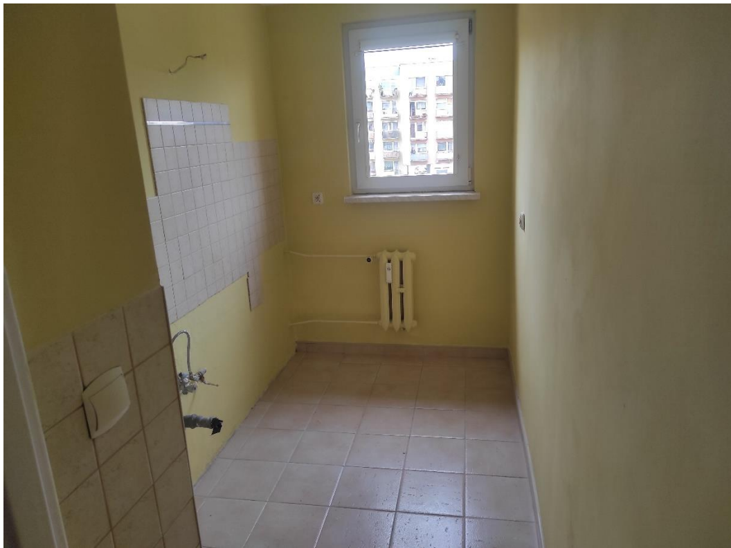
Zdj. 5 – widok na kuchnię