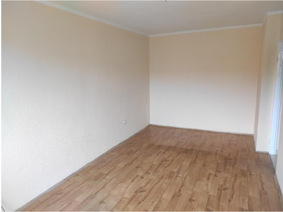
Zdj. 3 – widok na pokój